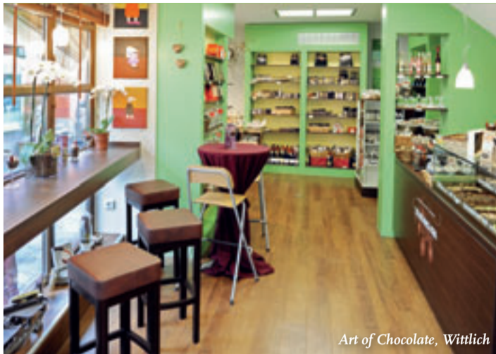
Art of Chocolate, Wittlich