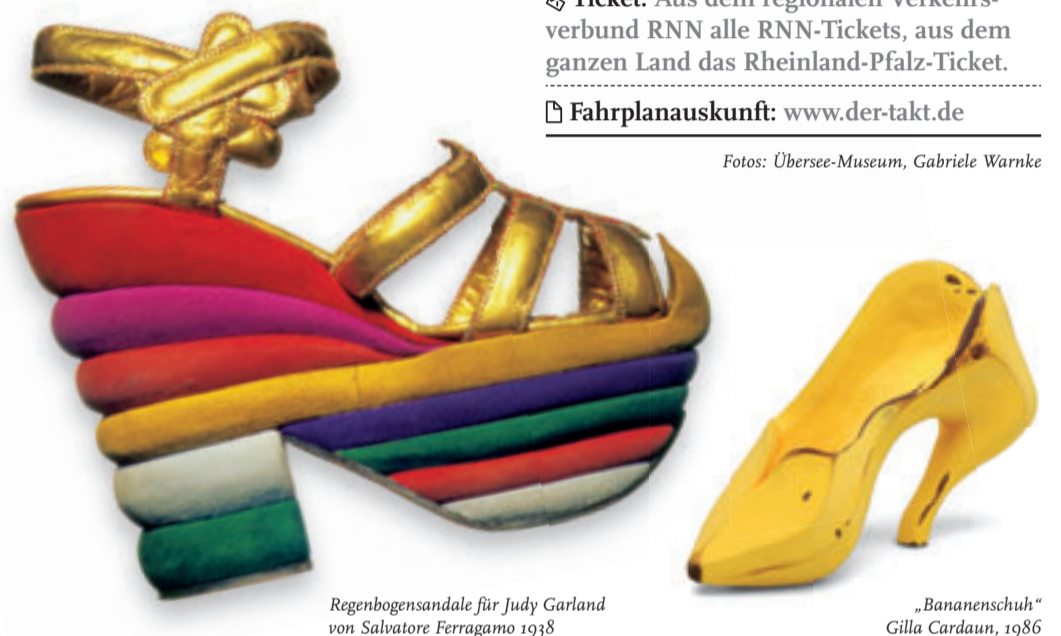
Regenbogensandale für Judy Garland von Salvatore Ferragamo 1938

📍 Mehr Informationen: „schuhtick“, Landesmuseum Mainz bis Ende Januar 2011 www.schuhtick-ausstellung.de Tel. 0 61 31 / 2 85 70