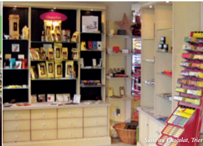
Suite au Chocolat, Trier