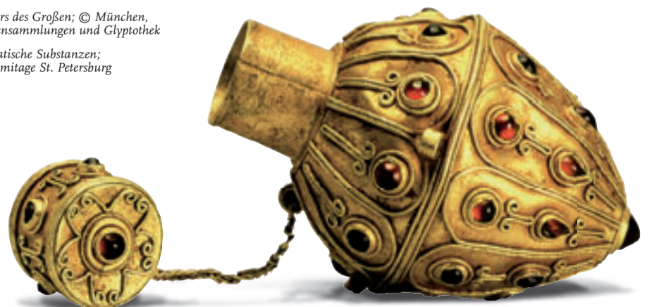
Flakon für aromatische Substanzen